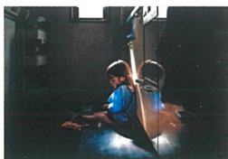
表紙のモチーフとなった作品 第58回キヤノンフォトコンテスト グランプリ 「ひみつ」ホシダシホ

※同じ作品を他部門に重複して応募することはできません。 ※CD-ROMやDVD-ROMなどメディアでの応募は受け付けておりません。 ※本リーフレットの注意事項の諸条件にご同意の上ご応募ください。